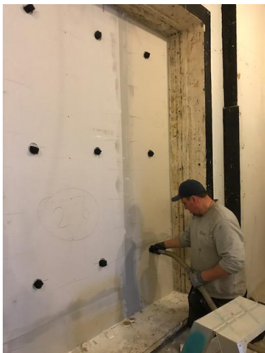
Foto af montage i laboratoriet