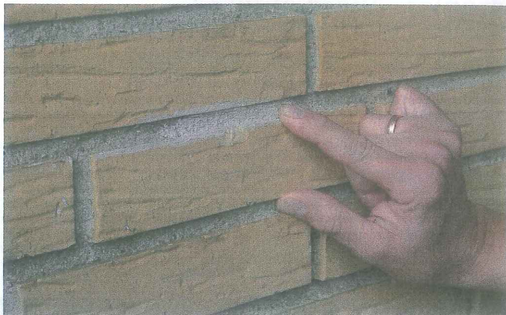
Det er næsten usynligt, hvor papirulden er pumpet ind.

Han havde i længere tid tænkt på, at det nok var en idé med bedre isolering. Men han holdt sig tilbage, fordi han var bange for, hulmursarbejdet ville ødelægge husets